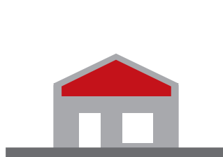
Aménagement de combles

Il s'agit de travaux sur constructions existantes : extension, surélévation, aménagement de combles ou de garage, etc. ces travaux sont soumis à Déclaration Préalable ou à Permis de Construire selon les surfaces du projet. Parfois, le recours à l'architecte est obligatoire. Cette fiche ne concerne pas les constructions à destination agricole.