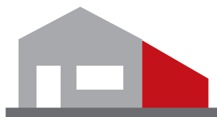
Extension d'une maison si le nouveau volume n'est pas accolé à l'existant, il s'agit d'une construction neuve*.