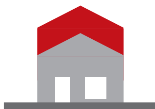
Surélévation d'une maison